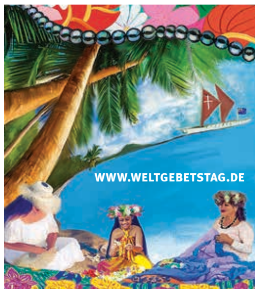
Bild: „Wonderfully Made“ von den Künstlerinnen Tarani Napa und Tevairangi Napa.

Mit vielen Legosteinen ganz ohne Grenzen bauen und kreativ werden – eingeladen sind alle Kinder zwischen sechs und zwölf Jahren aus dem Dekanat.