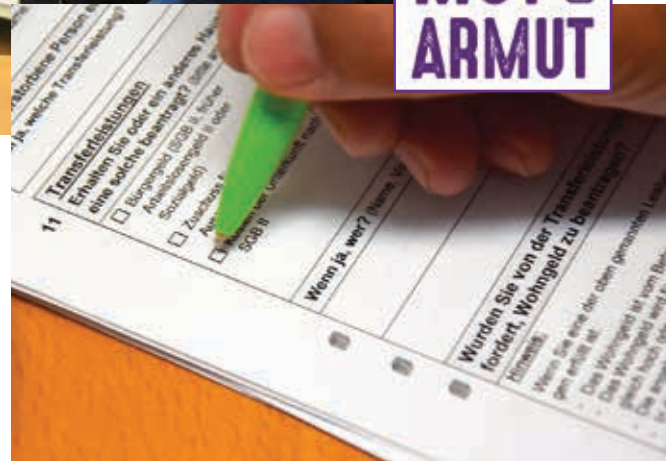
Im WAT gibt es Hilfe beim Ausfüllen der Formulare.

Jede Woche werden rund 20 Klienten vom WAT-Team intensiv beraten. Das ist deutlich mehr als vor der Corona-Krise. Schon durch Corona stiegen die Beratungszahlen, so Jochen Widmann: „Damals kam es im Gastgewerbe häufig zum Personalabbau.“ Nun wird spürbar, dass viele Firmen kurz vor der Pleite stehen. Oder insolvent sind. Oder dass